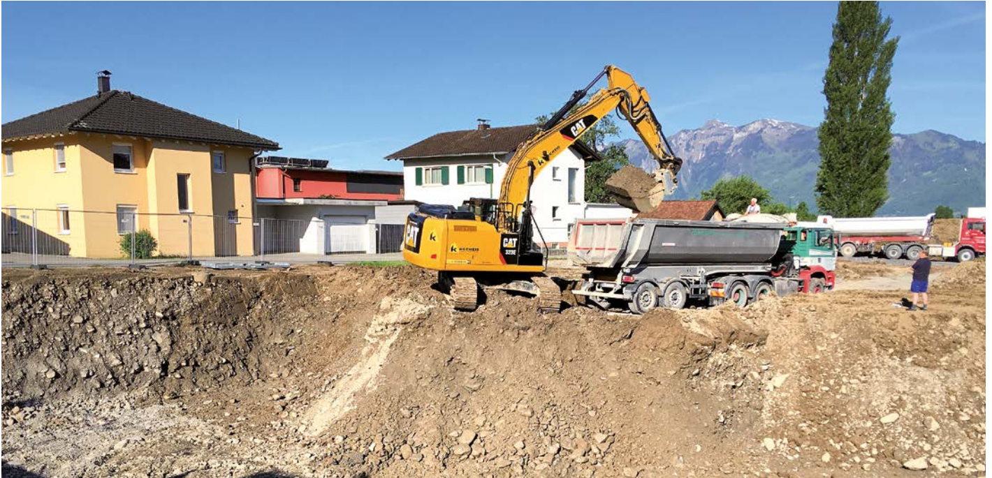
Bodenaushub beim Wohnprojekt „Alte Landstraße“

Die behördliche Bewilligung, die Bodenaushub-Deponie auf Malons zwischen Röthis und Viktorsberg zu betreiben, endet für das Bauunternehmen Hilti & Jehle 2020. Daher prüfen der Grundeigentümer – die Agrar Röthis – und der Betreiber – eine Arbeitsgemeinschaft bestehend aus Hilti & Jehle sowie der Firma Peter Keckeis – eine Verlängerung und Erweiterung der Deponie-Erlaubnis. Es sollen bis zum Jahr 2042 auf einer Fläche von 10 Hektar bis zu 840.000 Kubikmeter Aushubmaterial in diesem Tal gelagert werden dürfen.