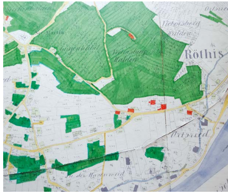
Katasterplan 1857