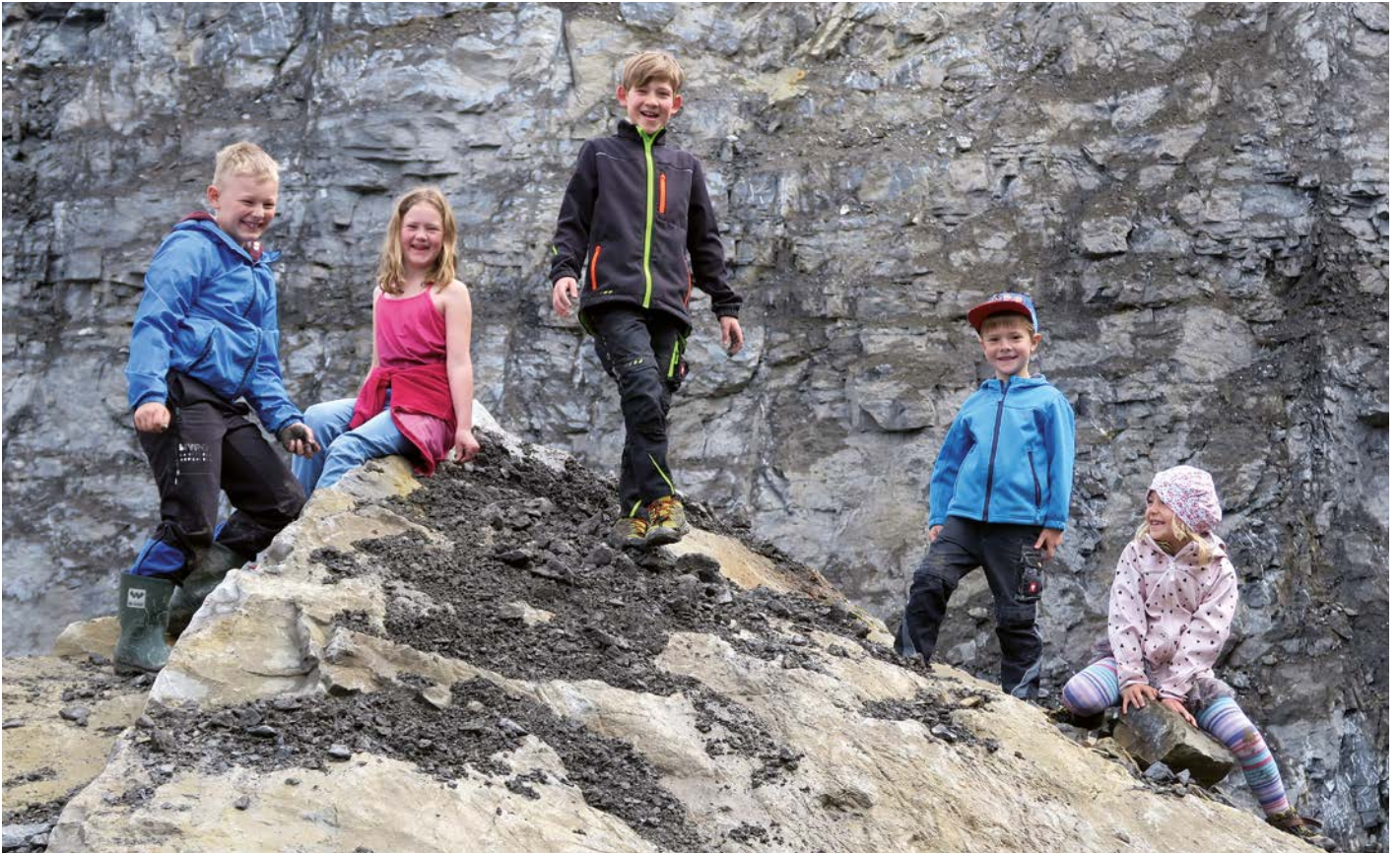
Die Arbeitsgruppe Spielraum durfte sich im Steinbruch der Firma Keckeis einen Kletterstein für die Schulwiese aussuchen.